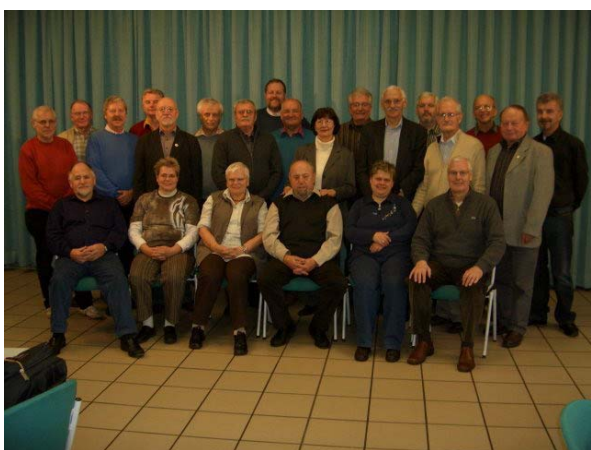
Abbildung 1: Teilnehmer des Senioren-Seminars vom 2. bis 4. November 2007 in Recklinghausen und Essen/Steele

Untergebracht waren wir im Hotel Domotel Barbarossa in Recklinghausen. Das Seminar fand statt im Gehörlosenzentrum Recklinghausen und im Martineum in Essen/Steele.